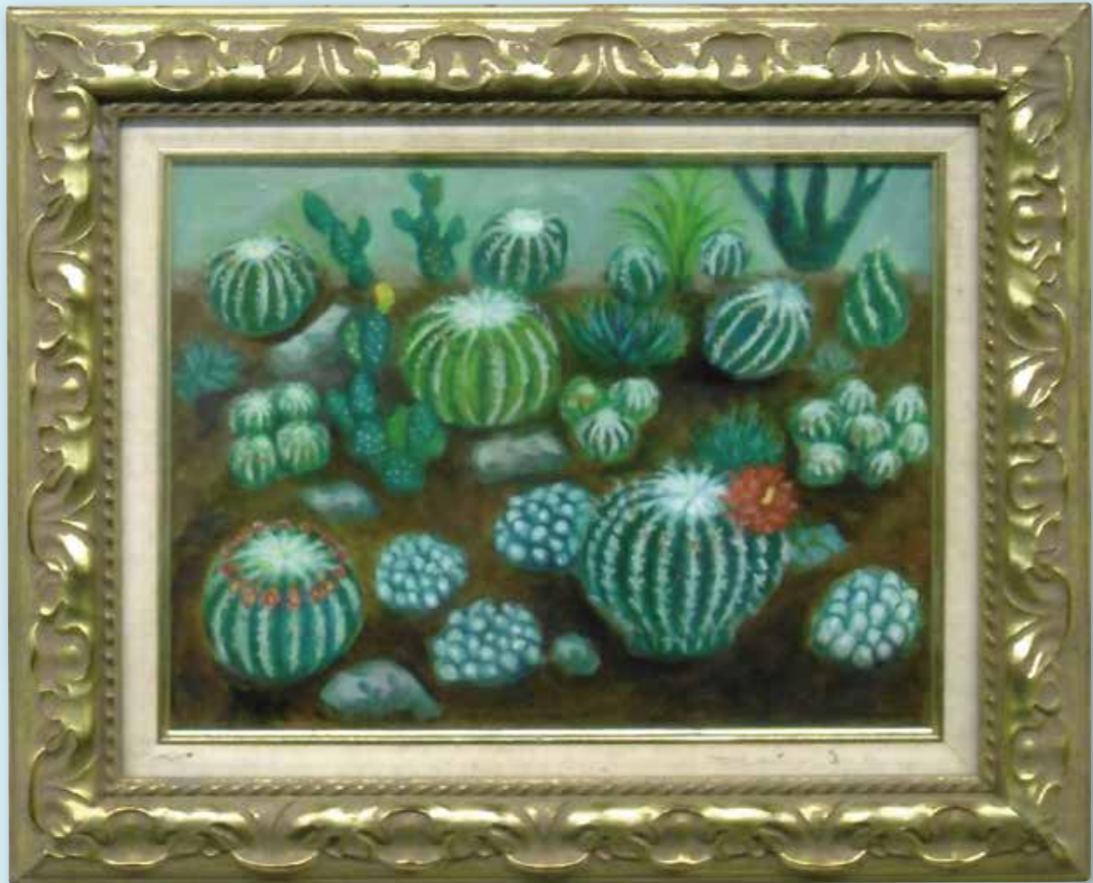
第31回千葉県教育芸術祭参加作品「サボテン」